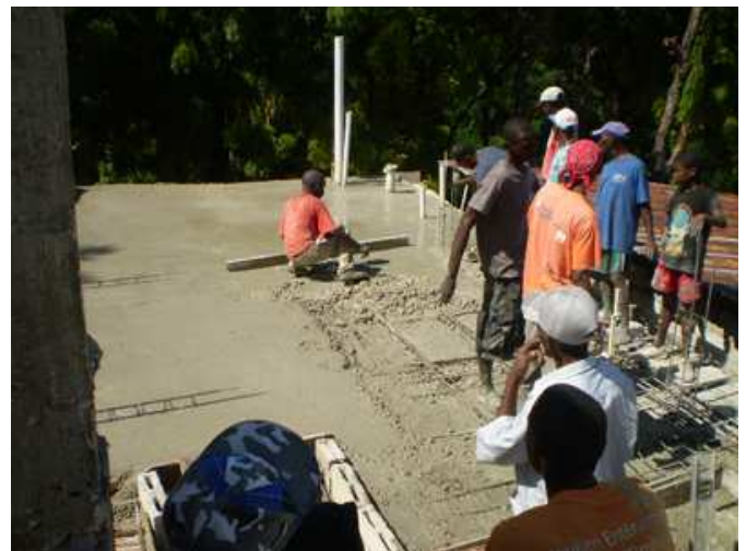
le béton est coulé