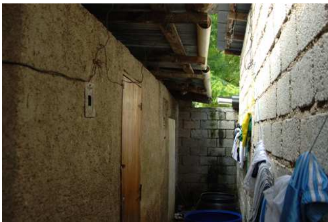
A gauche, la maison d'Ardens et Begin

Les travaux ont débuté début novembre : il s'agit de construire un étage de deux pièces au dessus de la maison d'Ardens et Begin. Au dessus de l'étage il y aura une dalle de béton qui servira de terrasse en plein air. Au 20 décembre il reste encore environ 10 jours de travail et le déménagement pourra se faire début janvier.