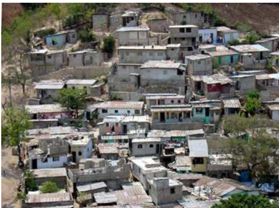
Quartier populaire de Port au Prince

Pour M. (19 ans) en seconde : coût de l'école (entrée+mensualités) 500 US$, livres 75 US$, chaussures 45 US$, uniformes 80 US$, divers (feuilles examen, photos, sorties de classes) 30 US$, nourriture 10 US$/mois, loyer 15 US$/mois = 1030 US$/an.