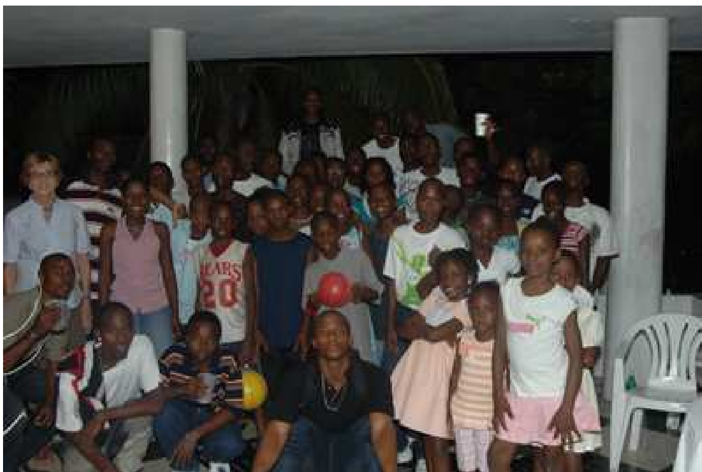
La traditionnelle photo de groupe pendant la soirée de Noël