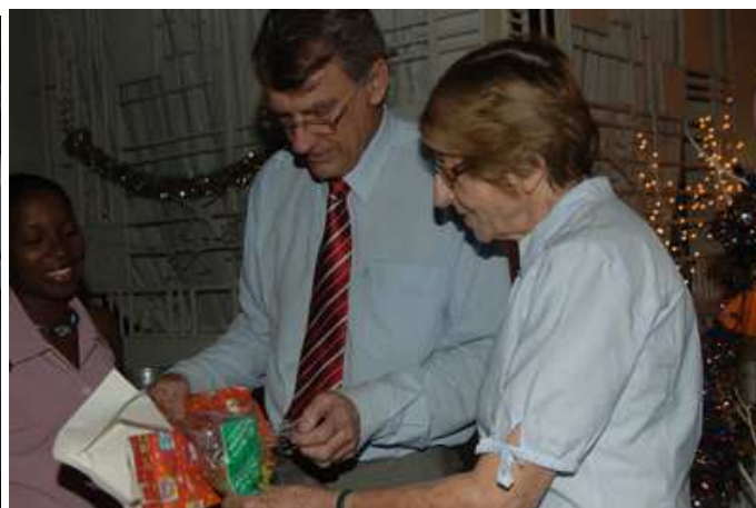
Ouverture d'un cadeau offert par Carène