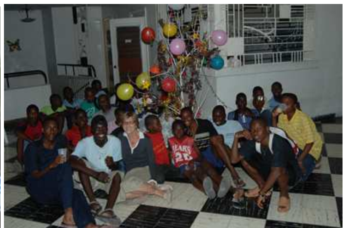
autour de l'arbre de Noël, avant le partage des cadeaux