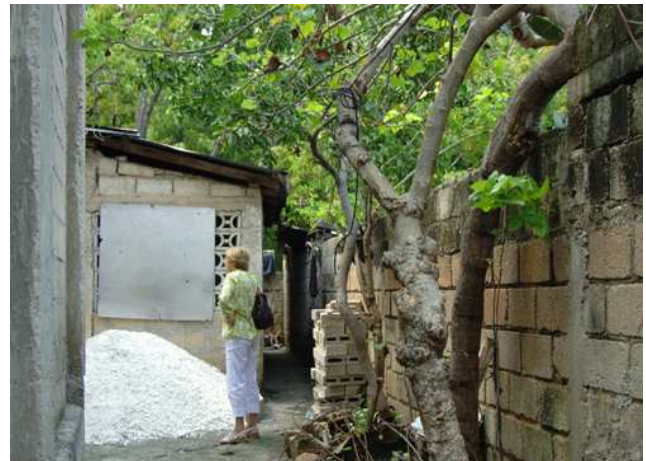
Visite des travaux par Danièle