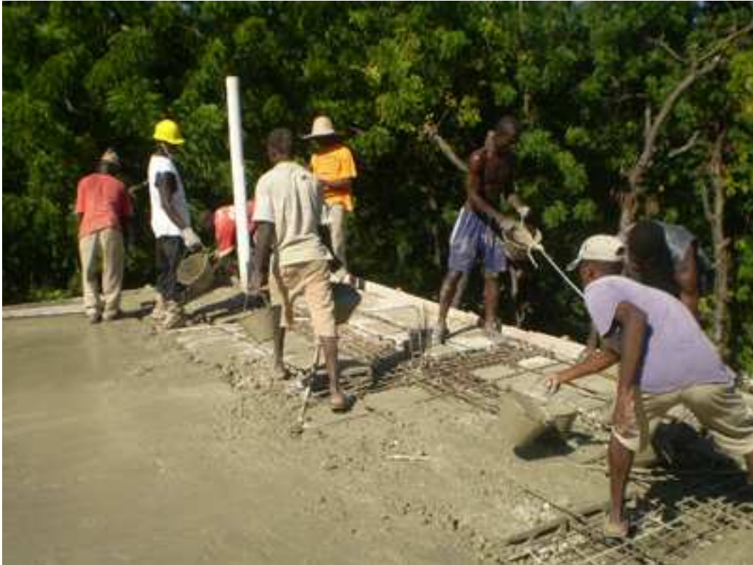
Travail en équipe