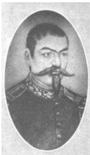
Sylvain Salnave Président du 14 juin 1867 au 19 décembre 1869