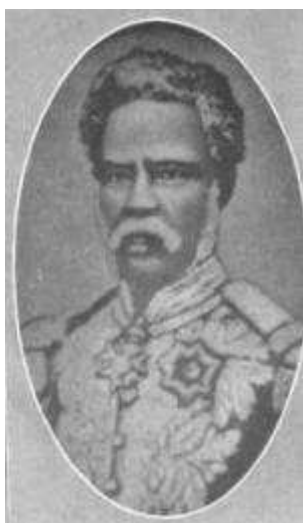
Nissage Saget Président du 19 mars 1870 au 14 mai 1874

Le 19 mars 1870 l'Assemblée nationale élit le Général Nissage Saget Président pour 4 ans.