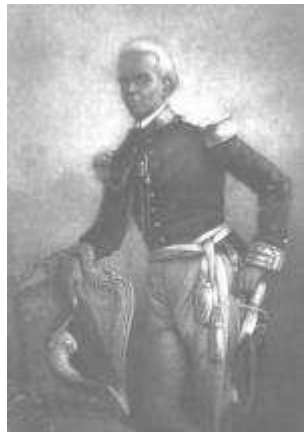
Fabre Geffrard Président du 23 décembre 1858 au 13 mars 1867

Sur le plan intérieur, les actions de Geffrard eurent plus de succès: l'armée fut réorganisée, avec une stricte discipline; l'instruction publique fut développée avec établissement de nombreuses écoles primaires et secondaires. L'école de médecine fut réorganisée et une école de musique établie. La République envoya de jeunes haïtiens faire ou compléter leurs études en Europe.